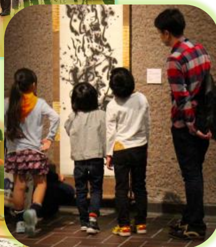
Museum start あいうえの (東京都美術館と上野の文化施設)