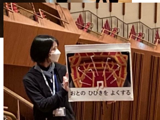
劇場ツアー やさしい日本語版 (東京芸術劇場)